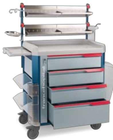
medicazione con supporto superiore e mensole inox dressing with over-bridge and S/S trays