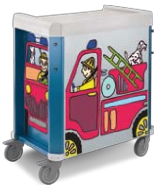
pediatria con grafica camion dei pompieri paediatric with fire truck graphic