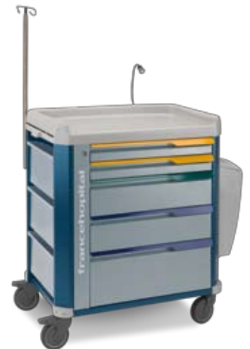
terapia intensiva con cassetti, asta portaflebo e luce intensive care with drawers, IV pole and small light

colorlight ha monoscocca in acciaio verniciato a polveri epossidiche di colore blu-opale. La costruzione è solida e robusta, ma allo stesso tempo il carrello risulta leggero e manovrabile.