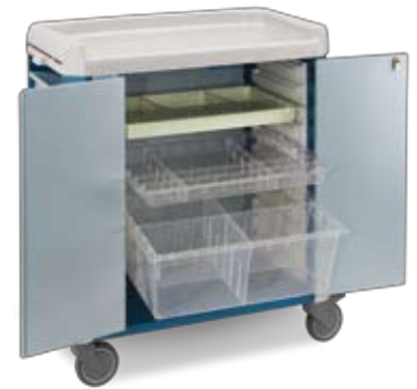
sistema a vassoio ISO 600x400 ISO 600x400 system