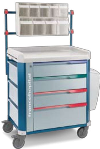
medicazione con supporto e cassettoni ribaltabili dressing with overbridge and tiltout bins