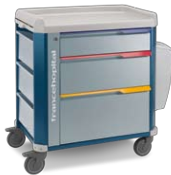
terapia con 3 cassetti therapy with 3 drawers