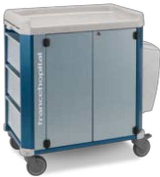
con chiusura ad ante with doors