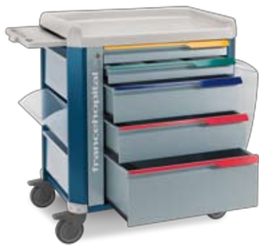
terapia con 5 cassetti therapy with 5 drawers