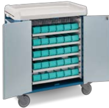
distribuzione farmaci con cassetto monopaziente medication distribution with patient bins