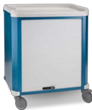
girovisita con chiusura a serranda visit-files with rolling shutter

colorlight is of a mono frame structure of opal-blue powder coated steel. The construction is solid and torsion free and keeps the trolley lightweight and manoeuvrable.